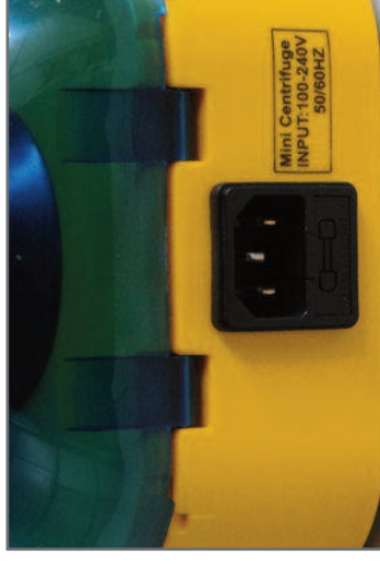
Détail de la prise de courant